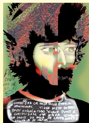
Salu e os trabalhos publicados na Computer Arts