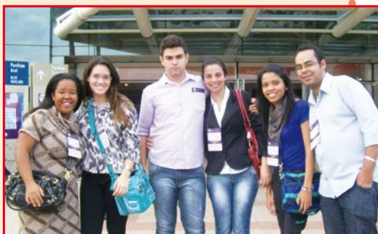
Parte do grupo na APAS

A APAS é realizada todos os anos e é uma imensa vitrine, com grandes expositores nacionais e internacionais, que divulgam os principais produtos e novidades que se tornarão tendências no mercado em diversos setores.