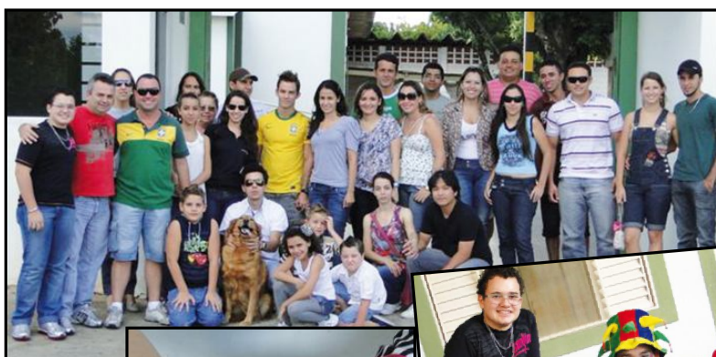
Os alunos de Processos Gerenciais na instituição: lições de solidariedade