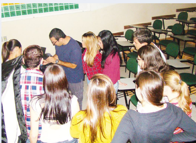
Logo acima, a oficina de fotografia digital. Na foto do alto, a mesa de interface tangível