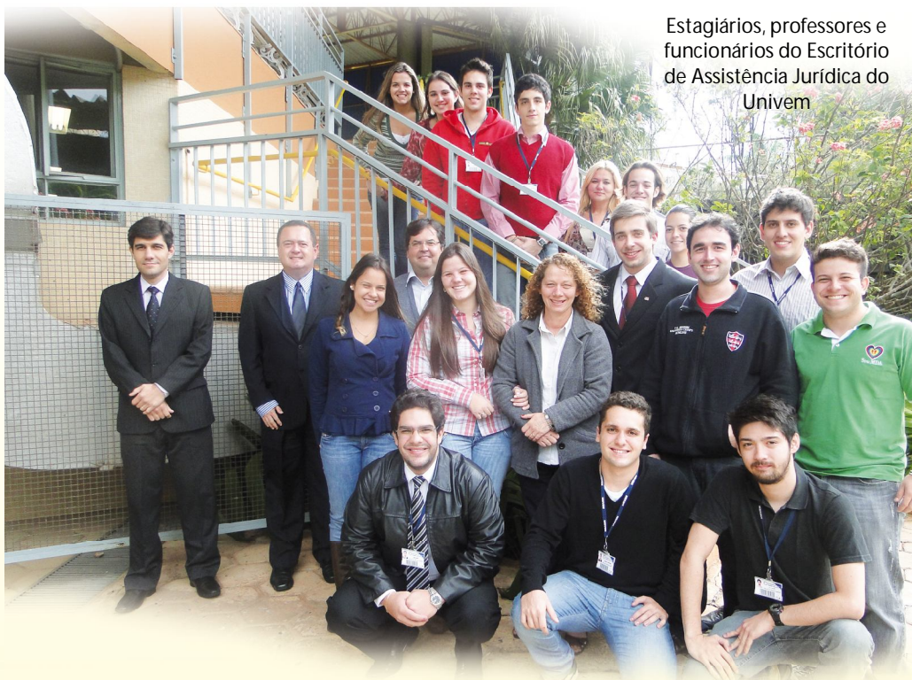
Estagiários, professores e funcionários do Escritório de Assistência Jurídica do Univem