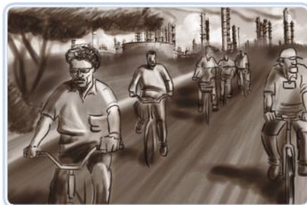
Figura 3 – Meio de locomoção para o trabalho

O acidente de trajeto pode ser entendido por aquele que ocorre no trajeto de ida para o trabalho como o de volta para casa, na figura abaixo sendo ilustrado pela locomoção de bicicleta.