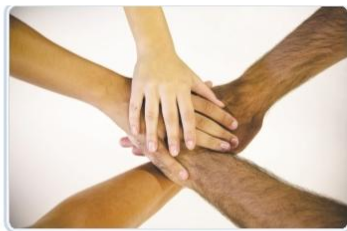
Figura 6 – Segurança em equipe

A eficácia e a eficiência das normas regulamentadas relativas à Segurança do Trabalho e prevenção de acidentes na Constituição Federal, CLT, Leis Previdenciárias (Lei nº 8.212/91 e 8.213/91) entre outras somente poderão ser realidade se houver integração de todos, empregado, empregador, União e sociedade, é um trabalho em equipe conforme ilustração.