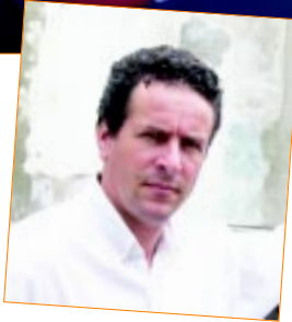
DORETTO e dois de seus trabalhos: estilo simbolista no Espaço Cultural do Univem