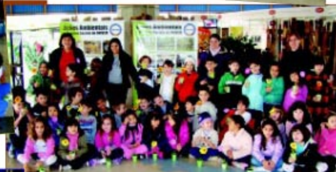
Colégio Cristo Rei (tarde)