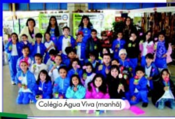
Colégio Água Viva (manhã)