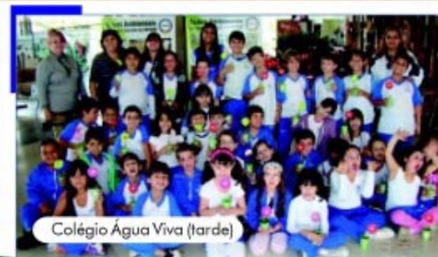
Colégio Água Viva (tarde)