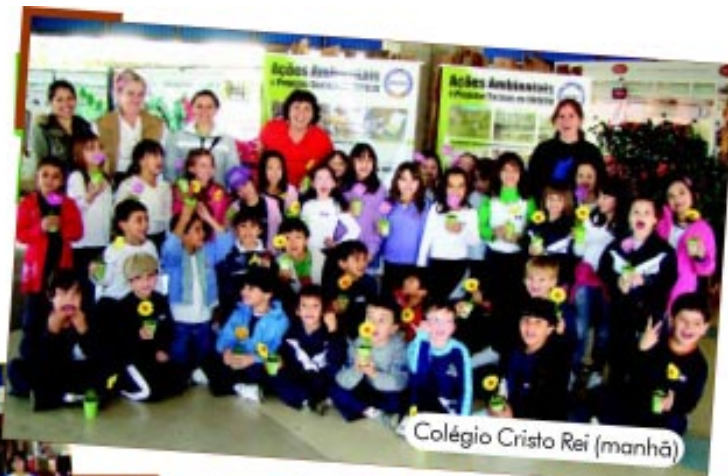
Colégio Cristo Rei (manhã)