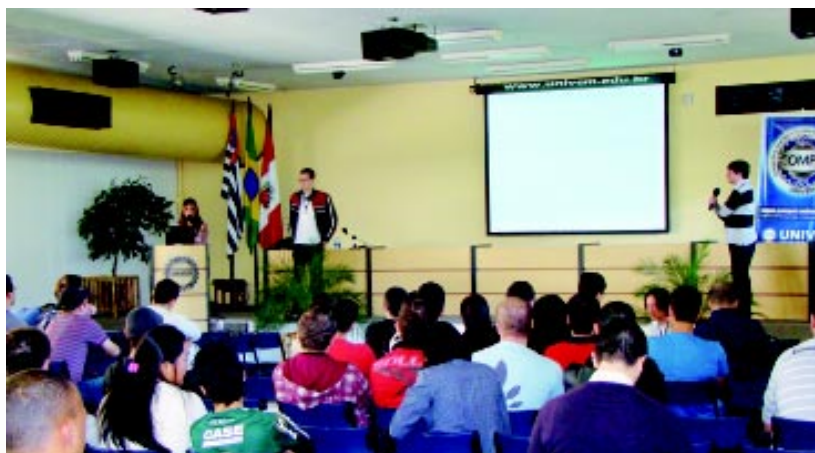
Evento já faz parte da agenda tecnológica de Marília

A entrada foi franca. Os inscritos foram estimulados a contribuir com um quilo de alimento não perecível. Os produtos arrecadados foram doados a entidades assistenciais.