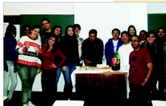
A confraternização da turma, no encerramento do primeiro módulo, no dia 2/6/2011